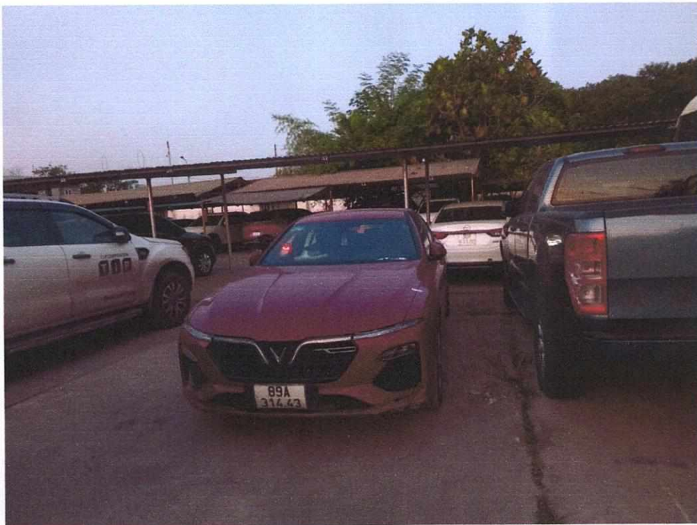
Hình ảnh chiếc xe đỗ tại nơi trông gửi giữ xe của TPBank.