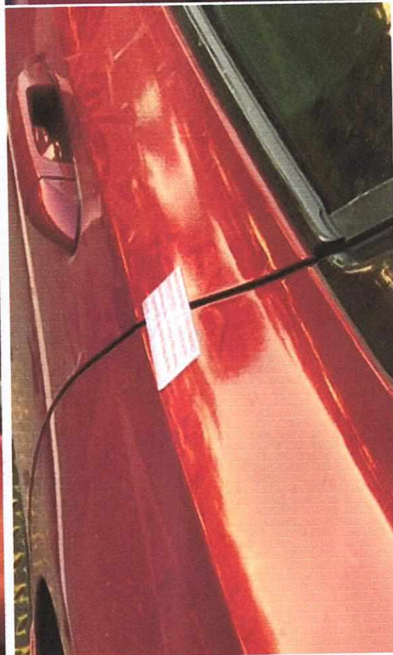
Hình ảnh cán bộ TPBank dán niêm phong tất cả các cánh cửa xe, nắp capo, nắp bình xăng, nắp cốp sau xe.