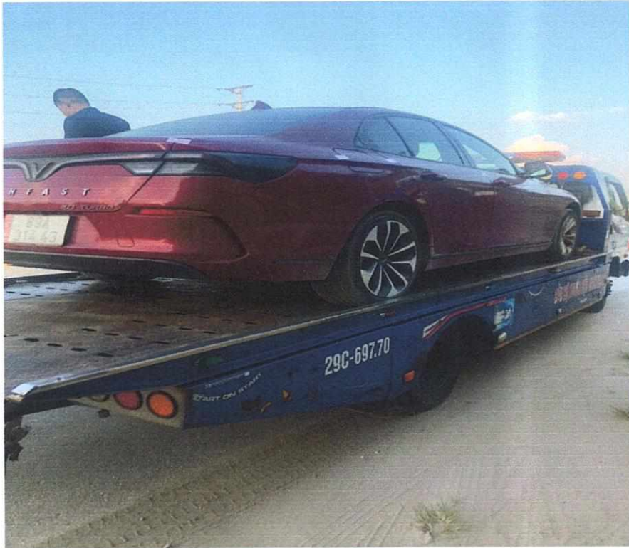
Hình ảnh chiếc xe cứu hộ cố định xe để trở xe di chuyển về nơi trông giữ xe.