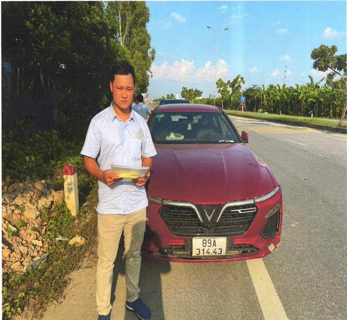
Hình ảnh đại diện TPBank tại buổi thu giữ tài sản bảo đảm của TPBank.

(Vi bằng số 1084 ngày 04 tháng 10 năm 2023)